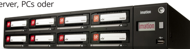
Imation RDX A8